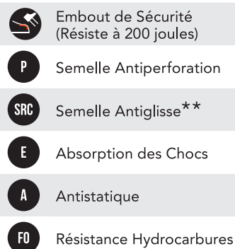
TABLEAU NIVEAU DE SÉCURITÉ